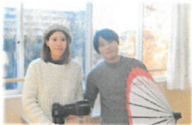
ココハナライフスタジオの皆様